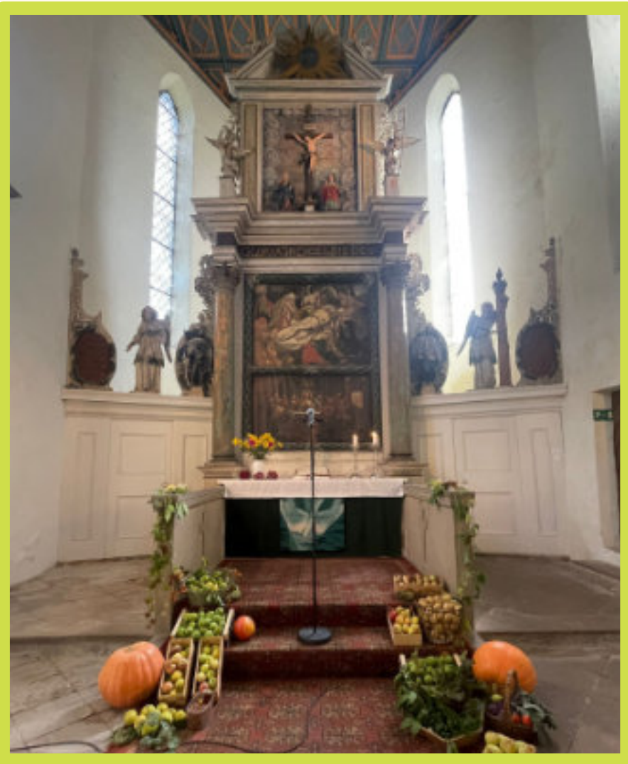
Erntedank am 5. Oktober 2025