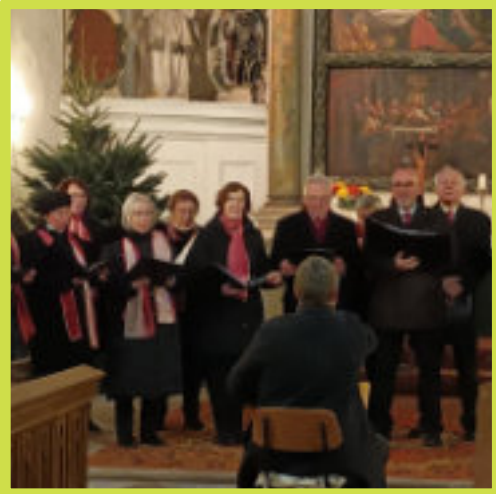
Konzert Chor Salutra Heimatverein