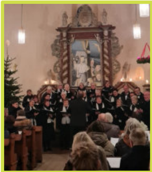
Konzert Chor Viva la Musica Hohenwarthe